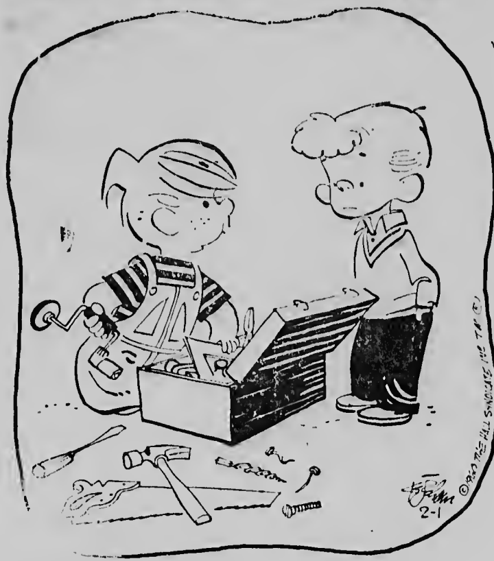
„Fijn spelgoed, hè?”